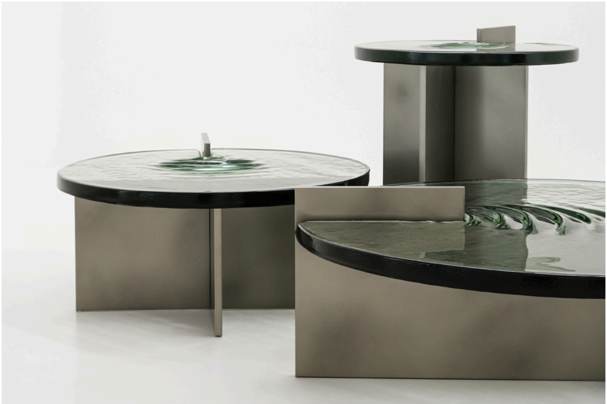
Au premier plan, les Round coffee table M et L accompagnées de la side table