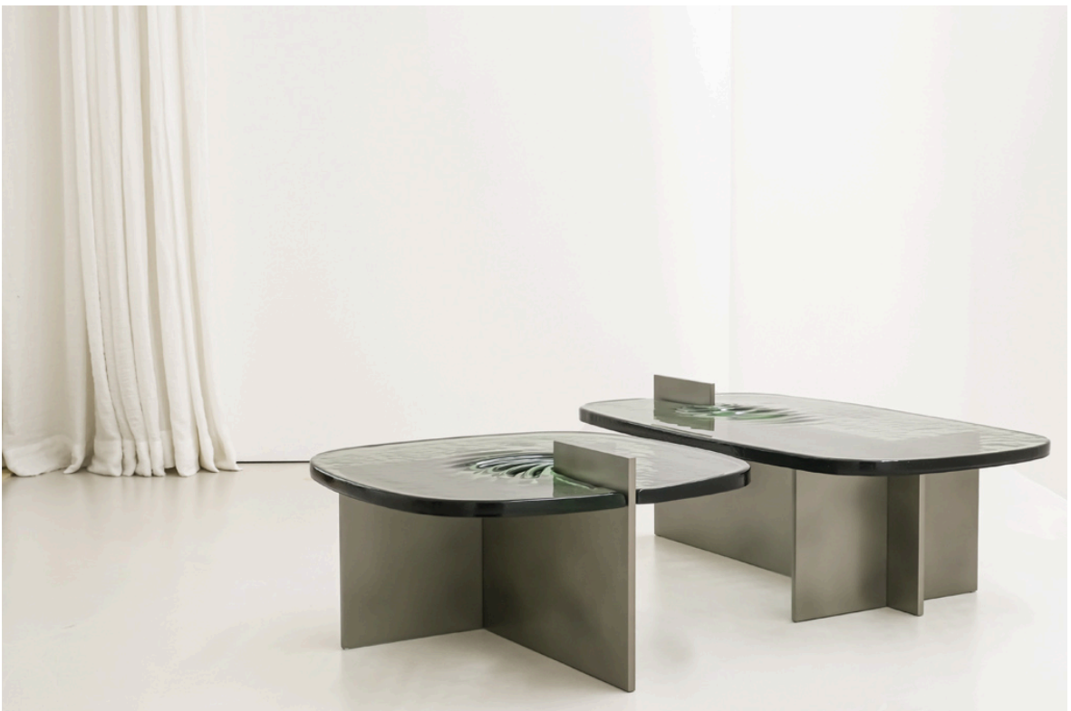
Les modèles Squircle coffee table M et L © Paul Louda

Indissociable de Murano, de son histoire et de sa géographie, la lagune est aujourd'hui une source d'inspiration pour de nombreux artistes dont la photographe Lucie Jean. Intéressé par sa série Down by the water dans laquelle elle capture les mouvements de la mer, Noé Duchaufour-Lawrance explique avoir « été ému par l'eau en mouvement, s'échouant sur les rives de l'île abandonnée après un trajet en vaporetto sur la lagune. » Également touché par « le contraste des textures entre les éléments liquides, le ciel nuageux et les murs de briques en ruine », le designer a dès lors cherché à matérialiser ces ressentis. « Il y a dans ces images quelque chose de figé. On ne sait plus s'il s'agit de liquide ou de solide et il voulait apporter cela dans ses créations » précise Claire Holive, responsable de l'agence. Une ambition concrétisée par un apport de mouvement dû, d'une part au travail de la matière, et d'autre part aux facultés de la lumière.