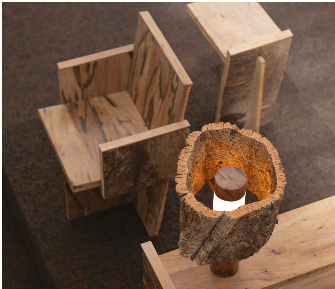
Made in Situ, design Noé Duchaufour-Lawrance, collection Chêne et Liège, exposition à la Villa Noailles, Design Parade 2023